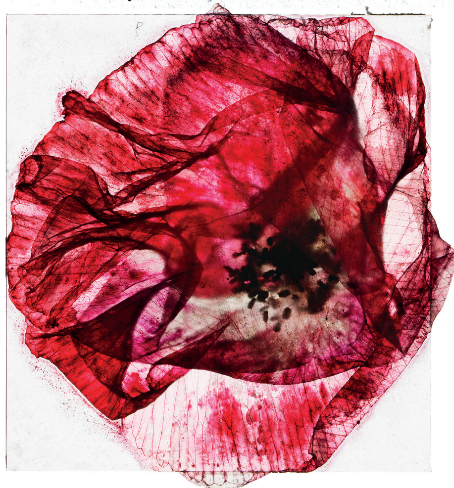
Bild: Sometimes they sing back to me © Brigitte Lustenberger - www.lufu.ch