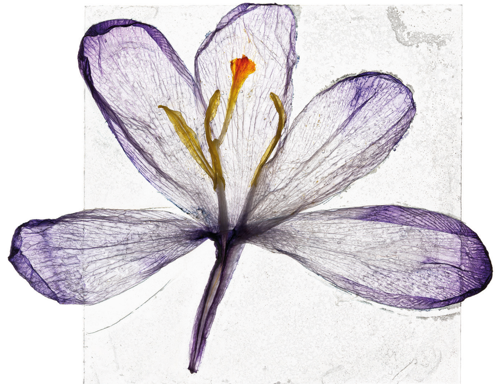
Bild: «We passed the setting sun»